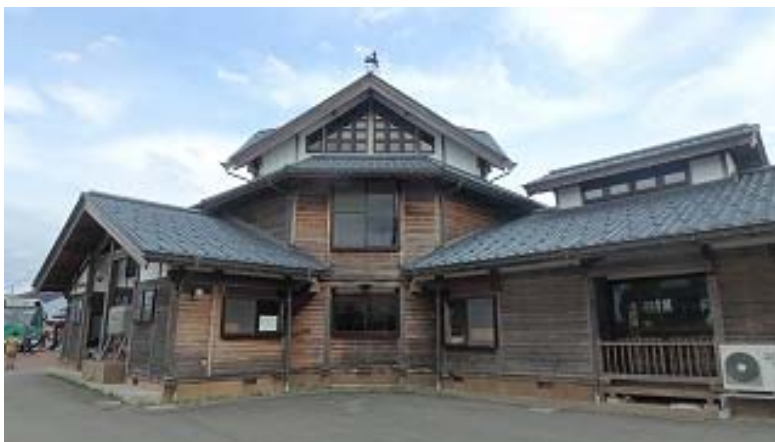
こまくさ保育園(新潟市北区豊栄)