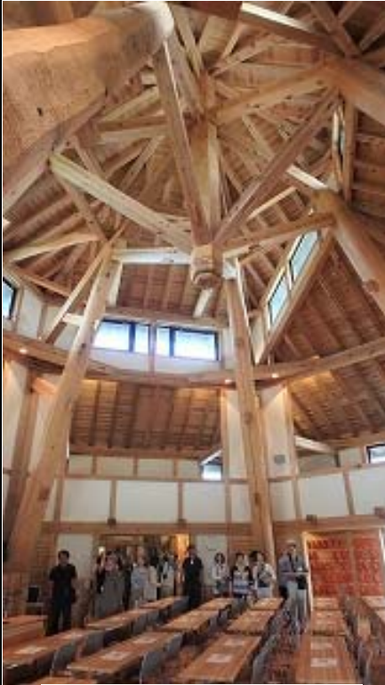
越後森林館（木組み架構）

わが国の伝統木造は、千年を超える歴史を持つ。社寺仏閣や民家など優れた建築が今も沢山残り、人々の心と生活を支えている。これらの維持管理には宮大工と家大工が担う。戦後制定された建築基準法は戦後のバラックを少しでも安全にするために筋違を入れ建物を固くし筋違の入った壁のみを耐力壁としている。建物架構を土台で基礎と緊結し固い建築とした。このため、阪神淡路や熊本地震では、筋違のある壁が壊れ建物が倒壊し多くの人命を失った。