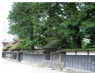
江戸の街並み(米沢街道)