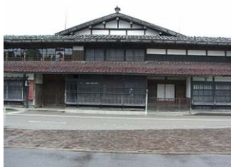
重要文化財渡邊邸

* 撞木づくり ：鐘を鳴らす T 型棒の平面形をもつ、通りに対して商業等で開かれた建築形式